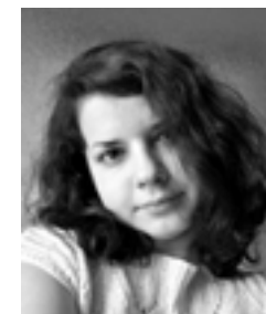
Za redakci, Kristýna Svidroňová

Přeji vám příjemné počtení a nový rok plný krásných sousoší.